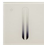
DIGITA V HF