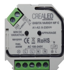
DIGITA VARIO 1 HF C TELEVARIATEUR