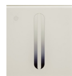
DIGITA V HF