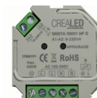
DIGITA ONO 1 HF C TELERUPTEUR